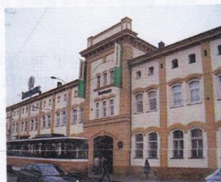
Akciový pivovar na Smíchově, později Staropramen, Praha, 1871